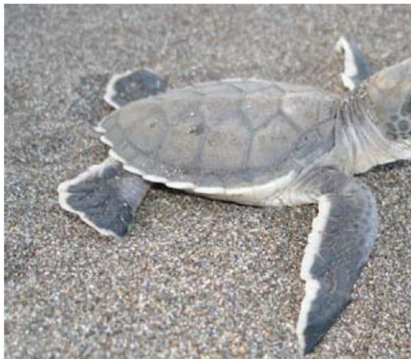
Eric Gay. Tortuga verde ( Chelonia mydas )