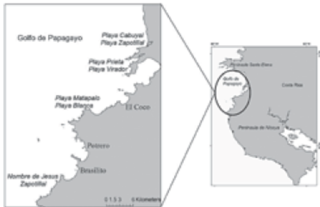
Figura 1: Playas de anidación de tortuga negra o verde del Pacífico ( Chelonia mydas ) en Guanacaste. Las playas recorridas que presentaron un número importante de "camas" de tortuga negra (> 50 posibles nidos) son Nombre de Jesús, Zapotillal, Matapalo, Blanca, Prieta, Virador y Cabuyal.

Durante los recorridos de playas, el mayor impacto registrado fue la recolección ilegal de huevos. Esta actividad fue observada principalmente en las playas Matapalo y Cabuyal, donde aproximadamente el 50% de los nidos se encontraba excavado al momento de la observación. El desarrollo también es un factor que impacta