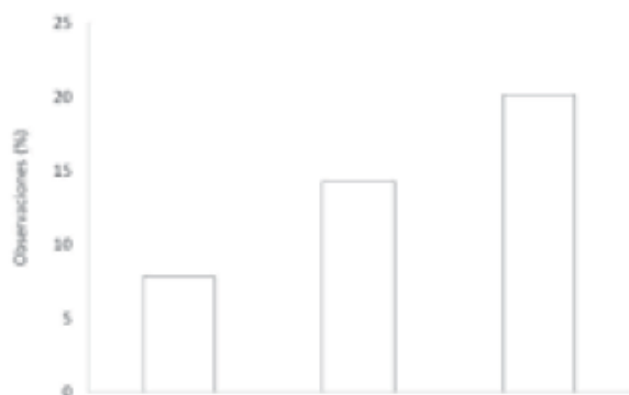
Figura 2. Porcentaje de observaciones realizadas en Nombre de Jesús, Zapotillal y Cabuyal, clasificadas por categorías. La más frecuente fue el saqueo de huevos (20.1%), luego prácticas turísticas sin control (14.3%) y, por último, la pesca artesanal (7,8%).