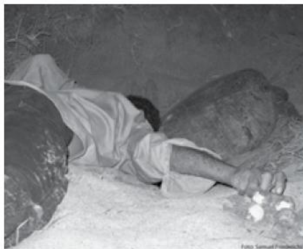
Figura 3. Práctica frecuente en playa Nombre de Jesús. Extracción de huevos durante el proceso de desove de una tortuga negra ( Chelonia mydas ).

El ecoturismo puede representar una fuente de ingreso para las comunidades cercanas a playas de anidación de tortugas marinas (Tisdell y Wilson, 2002). Cuando esta práctica es realizada de forma organizada, contribuye al conocimiento y a la educación acerca de especies en peligro de extinción, lo cual compromete a turistas de diferentes lugares del mundo con la conservación (Tisdell y Wilson, 2005). Este no es el caso de las playas de Guanacaste, donde el turismo sin control afecta altamente a las tortugas negras. Generalmente, las tortugas retornan a la playa sin anidar o suspenden el nido y vuelven al mar todavía cargando huevos con cáscara en el oviducto. Si bien las tortugas marinas tienen la capacidad de mantener huevos por largos periodos (Casares et al. , 1997; Plotkin et al. , 1997), estas vuelven a la playa la misma noche o la noche siguiente, ya sea para desovar el nido completo o para desovar los huevos restantes. Esto causa un mayor gasto energético que el necesario para una temporada de anidación y puede impactar en el número total de nidos que desovará la tortuga en una tempora-