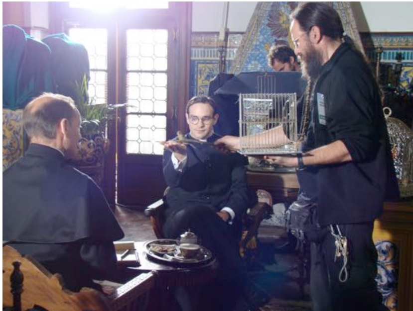
There be Dragons? (Dir. Roland Joffé 2011) Training of birds, horses and dogs.