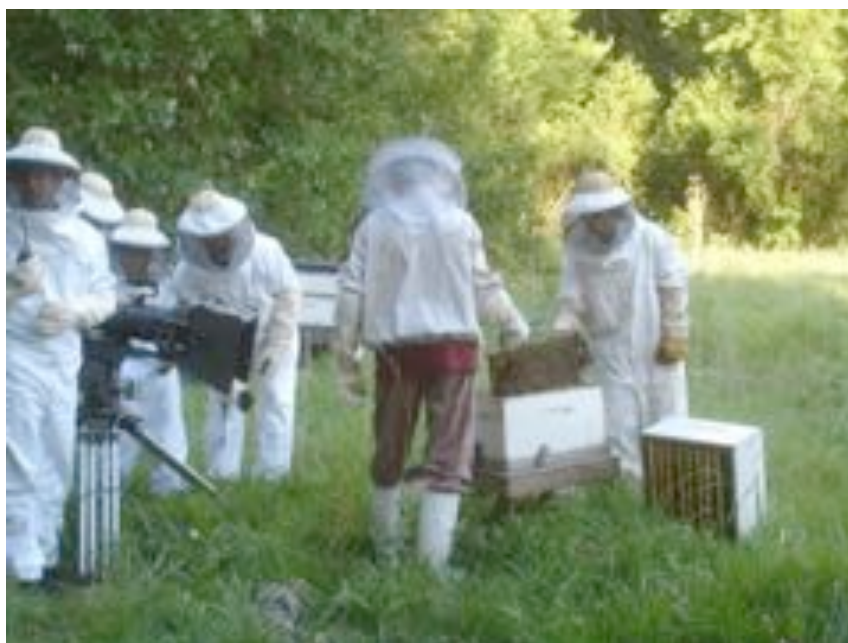
The City of Your Final Destination (Dir: James Ivory) (2008) Training of bees