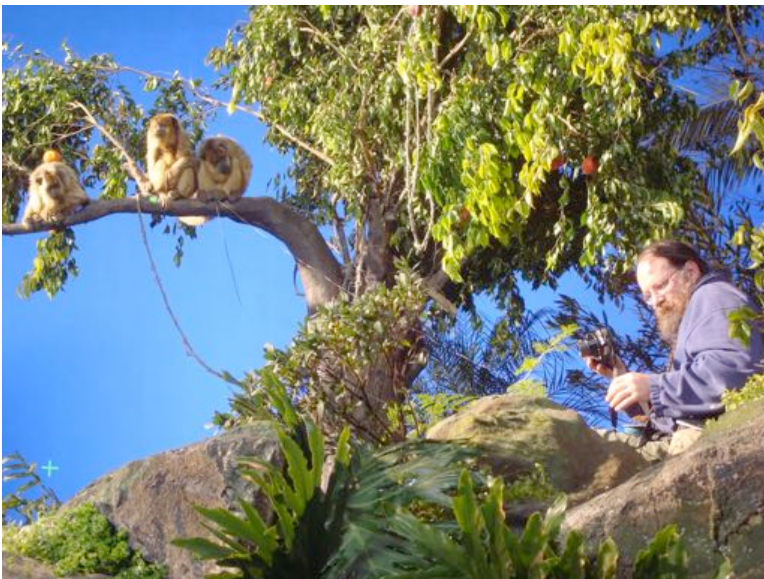
New world monkeys