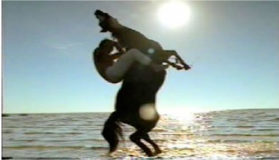
The Fall: El sueño de Alexandria (Dir: Tarsem Singh) 2006 Horse falling training and stunt coordination