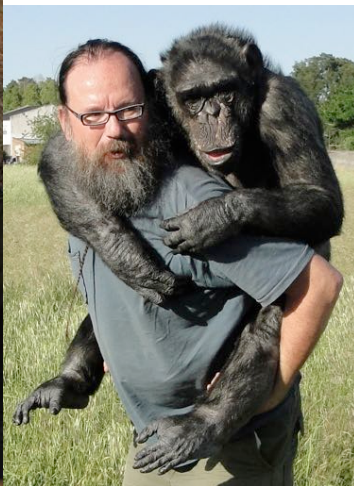
Adult male chimp