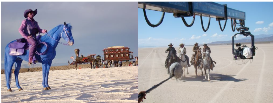
Lucky Luke (Dir: James Huth) 2009 Horses Training

https://vimeo.com/127194049 Cats food commercials