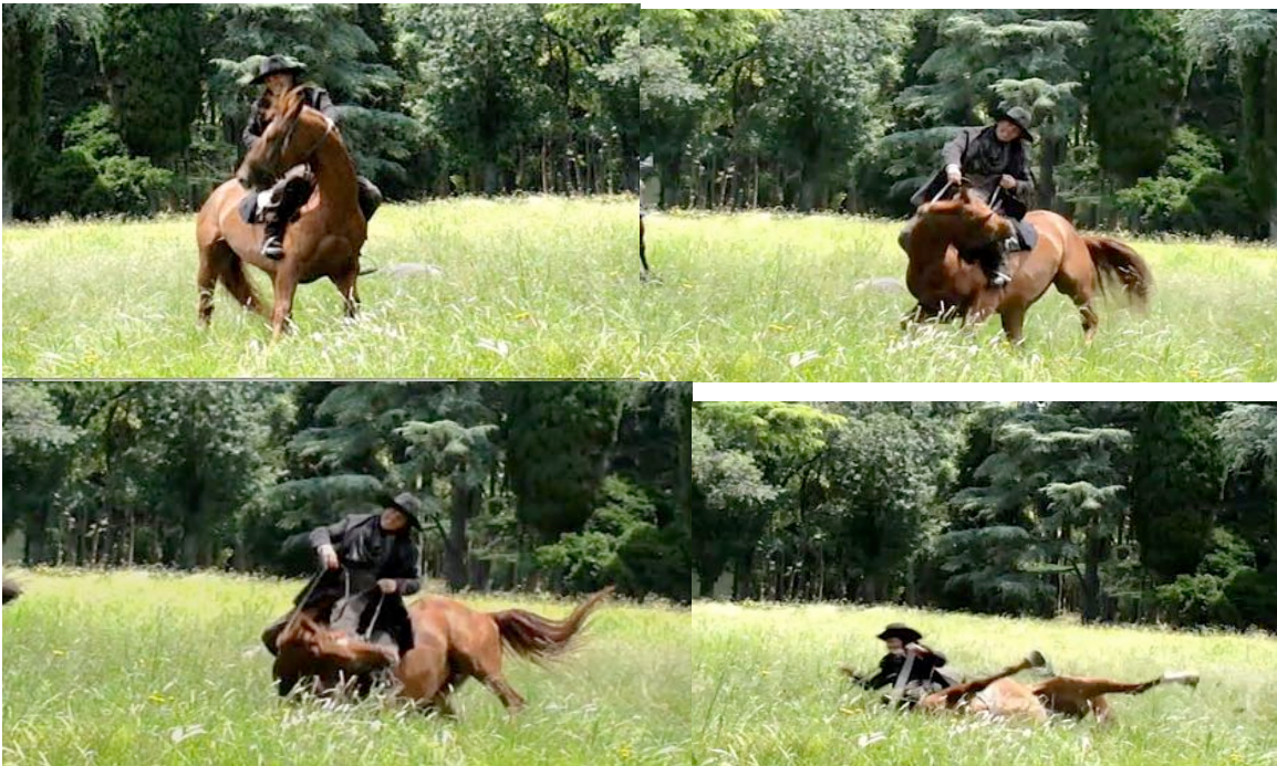
Terra Ribelle (Dir. Cinzia TH Torrini) 2010 Horse training for controlled falling