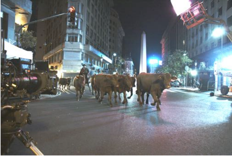
Cows and bulls