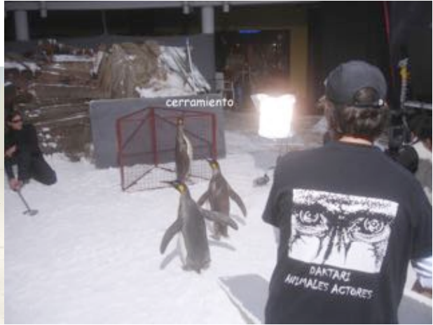
Penguins Shooting Guinness 2006, Audi 2003