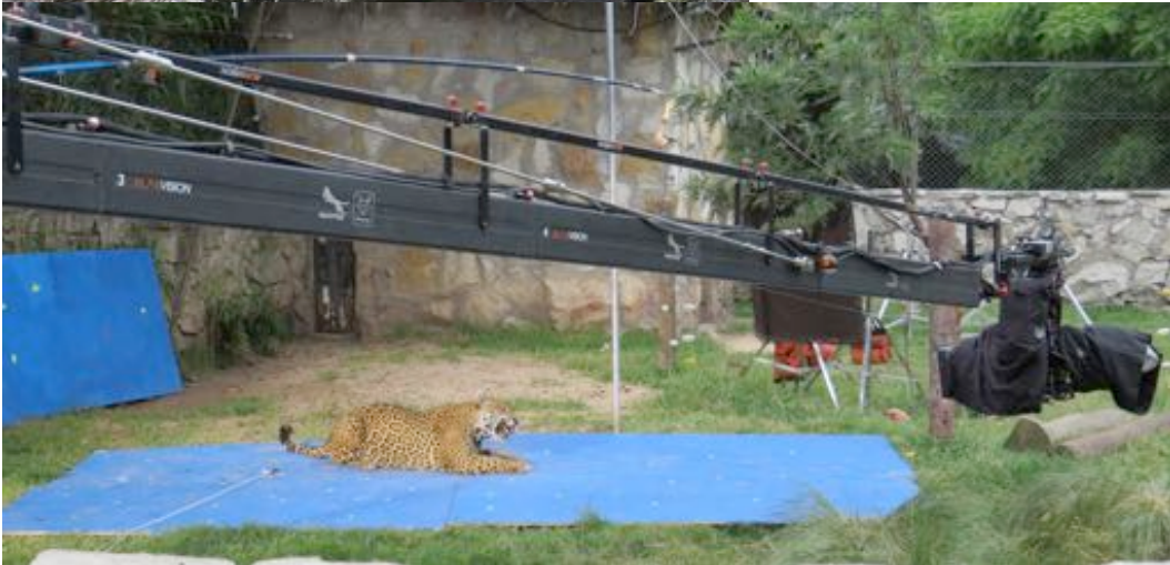
Shooting with felines