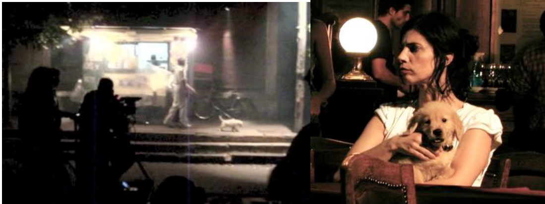
Tetro (Dir. Francis. F. Coppola) 2009 Training of dogs and moths