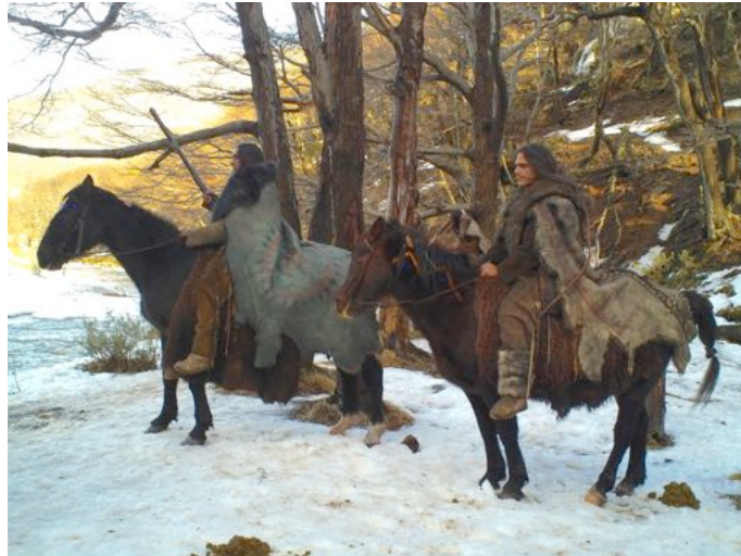
The Revenant (Dir:A.G. Iñárritu) (2016) Horse casting and training, South american crew